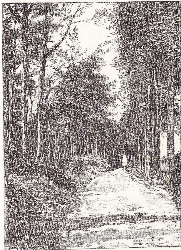
La lisière du Rondenbosch, à Bodeghem-Saint-Martin.

verdoyants entrecoupés de bosquets. A vingt minutes de marche de votre point de départ, la route fait un coude avant d'arriver à une petite ferme. Voici le moment de l'abandonner et de filer par le sentier de gauche qui traverse